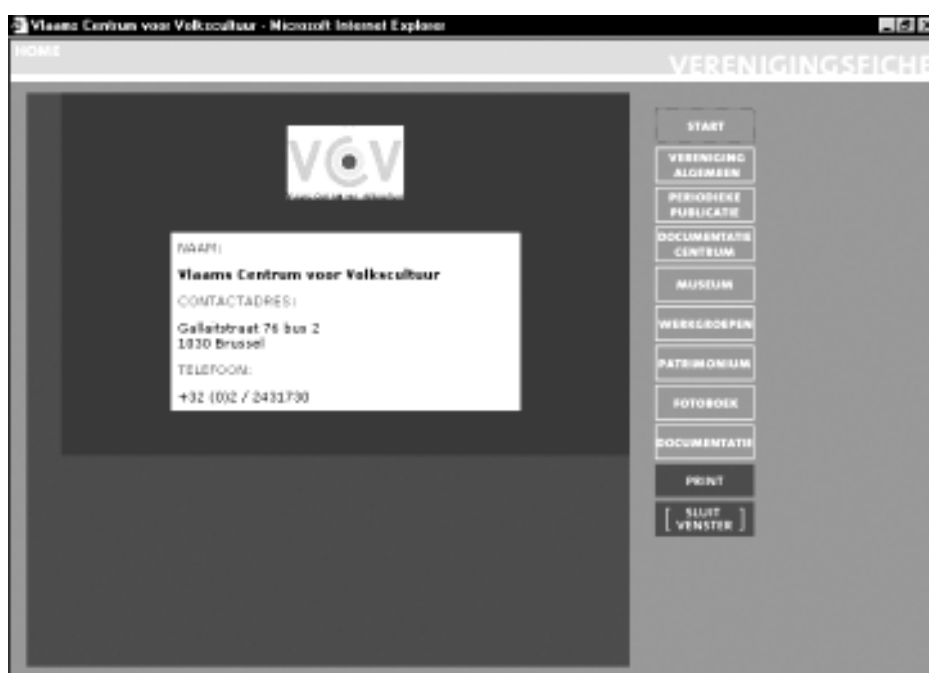
Voorbeeld van een eerste pagina verenigingsfiche voor het publiek (v.b. VCV)

- enerzijds via de verenigingswijzer die centrale toegang voor het grote publiek aan te bieden, waarbij zij uiteraard kunnen doorklikken naar de websites van de in de databank opgenomen verenigingen, wat een meerwaarde be-